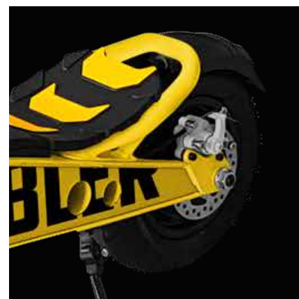
Ruote Tubeless 110/50-6.5"