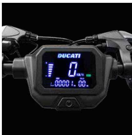
Ampio display LCD da 3.5"