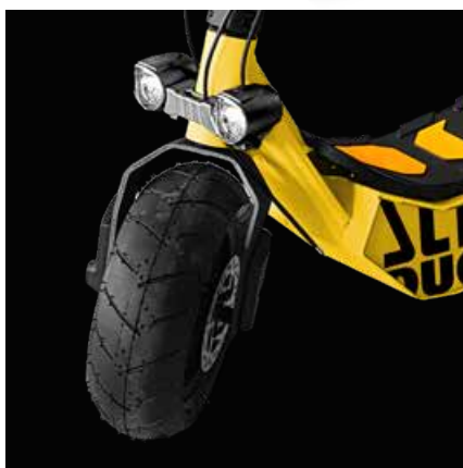
Doppio faro anteriore a LED