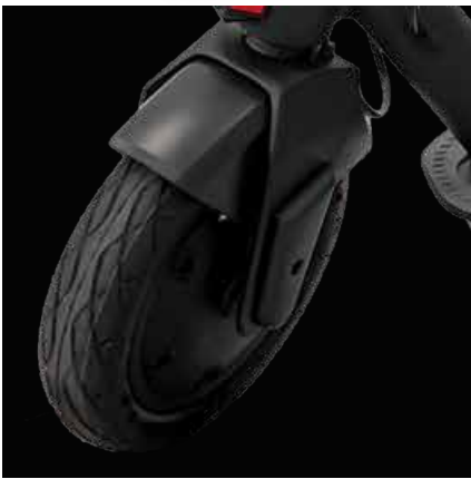
Ruote Tubeless da 10"