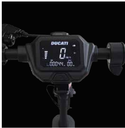
Ampio display LCD da 3.5"