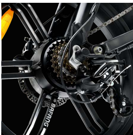
Motore Bafang 48V, 250W, 60Nm