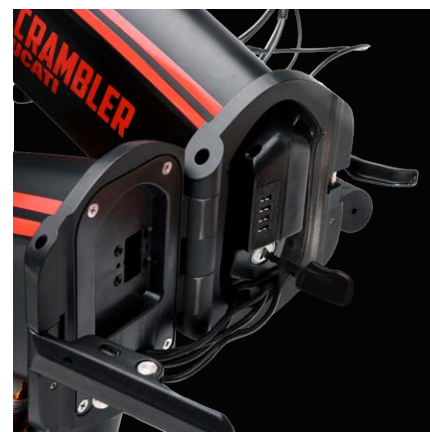
Batteria integrata nel telaio