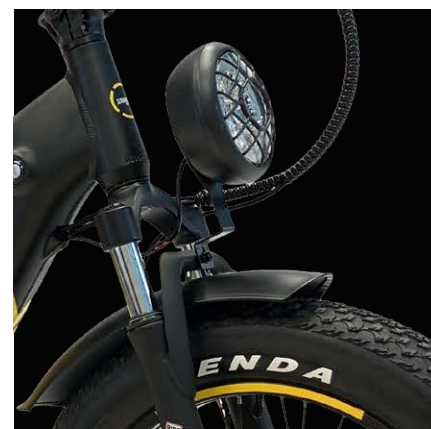
Ampio faro anteriore