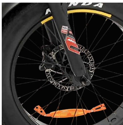
Freni a disco idraulici